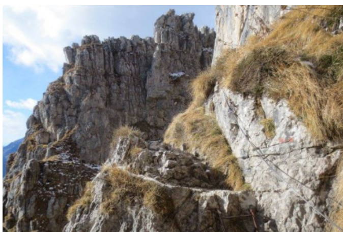
Sentiero attrezzato degli Stradini

Da qui inizia la ferrata (circa 1.45 ore di percorso, 130 metri di salita e 100 di discesa), che si presenta per un susseguirsi di passaggi verticali, sia in salita che in discesa, e di passaggi sul filo di cresta, quasi sempre esposti. La Via assume prevalentemente le caratteristiche di un sentiero attrezzato lungo una cresta che sorprende continuamente per l'alternanza di tratti rocciosi ad altri "verdeggianti", con alcuni pinnacoli che ricordano marcatamente l'ambiente dolomitico. Un ultimo canalino detritico di pochi metri segna la fine della ferrata Mario Minonzio. Ci si trova, improvvisamente, dall'ombra delle pareti Nord ed Ovest al sole della Cresta Sud. Girando a sinistra, per evidente sentierino, in pochi metri si raggiunge la cima del Dente dei Campelli a 2173mt, maggiore elevazione del gruppo dello Zuccone Campelli.