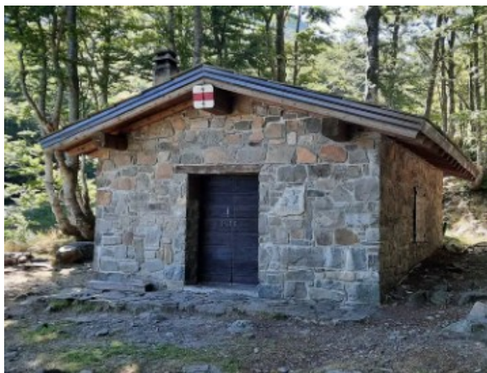
Il Bivacco Ghiaccioni

Verso le 13 ipotizziamo di essere tutti al Bivacco Ghiaccioni, per una bella grigliata in compagnia (salsiccia, salame, formaggio e ovviamente vino). Per i dolci confidiamo nella buona volontà di qualche partecipante.