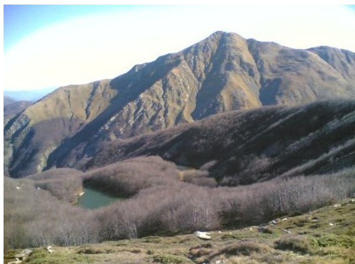
L'Alpe di Succiso dal sentiero 00; in basso a sinistra il lago del Monte Acuto

che percorre la cresta sud ovest dell'Alpe, fino ad arrivare a Pietratagliata (q. 1779 m. - prima del passo qualche passaggio che richiede l'uso delle mani).